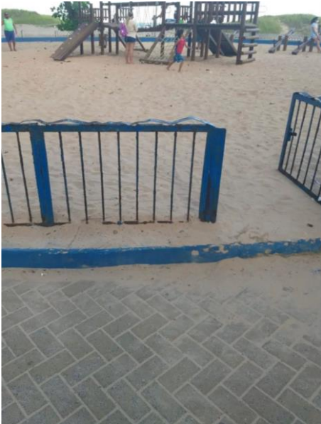
Foto Parquinho em frente ao Primeiro Jardim, na orla do Pina, Boa Viagem-Recife/PE.