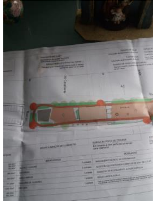
Projeto original entregue a comunidade da Paróquia