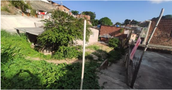
Foto Rua Palmelo, COHAB, Recife.