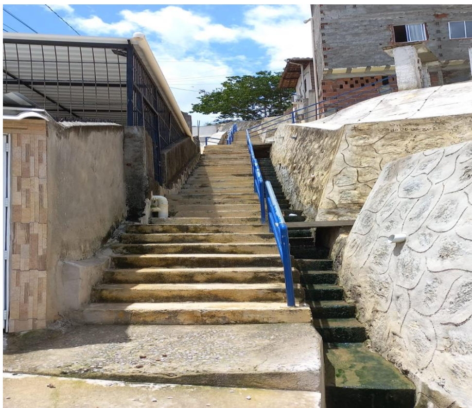
figura 2 - imagem real da escadaria a ser nomeada