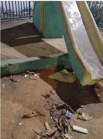
Foto da Praça da Rua Alto José Bonifácio S/N Casa Amarela - em frente a escola estadual Caio Pereira e ao lado da Quadra do Bonifácio, Recife.