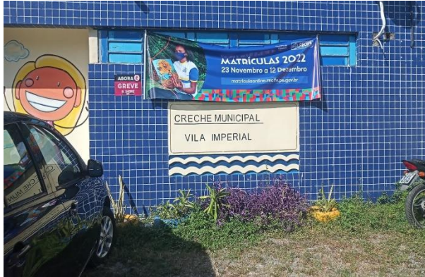
Foto da Escola Municipal Vila Imperial, Av. Pedro de Melo Pedrosa, s/n, Arruda, Recife.