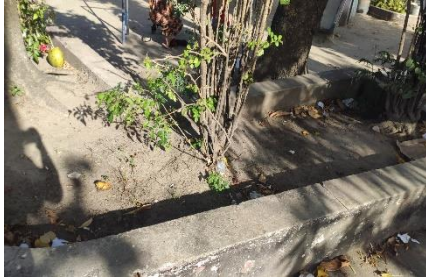
Foto da Praça Douraci Joaguim, no Largo da Mustardinha, Mustardinha, Recife.