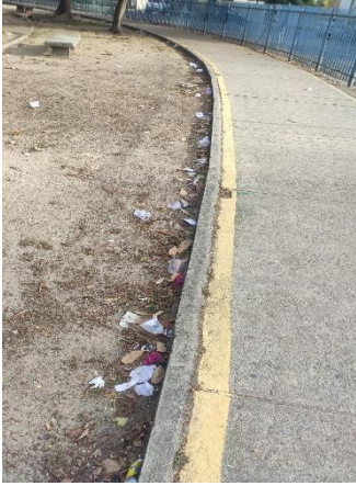
Foto da Praça de Jardim São Paulo, Recife.