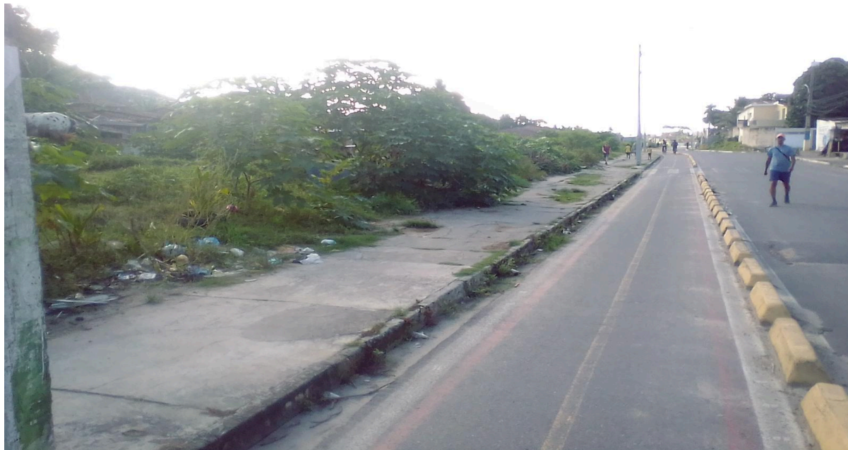
Imagem 1 - Vegetação e resíduos sólidos às margens do Rio Beberibe, à Rua Compositor Vinícius de Moraes, no bairro de Dois Unidos.