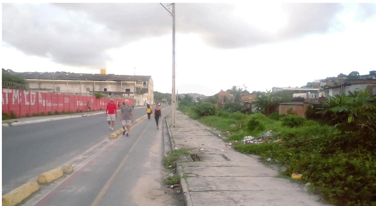
Imagem 2 - Vegetação e resíduos sólidos às margens do Rio Beberibe, à Rua Compositor Vinícius de Moraes, no bairro de Dois Unidos.