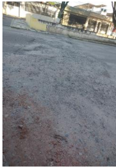
Foto Av. Senador Robert Kennedy, Recife