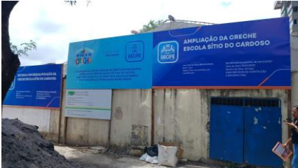
Foto Creche Municipal Sítio do Cardoso, Rua Padre Landim, 89 - Torre, Recife.