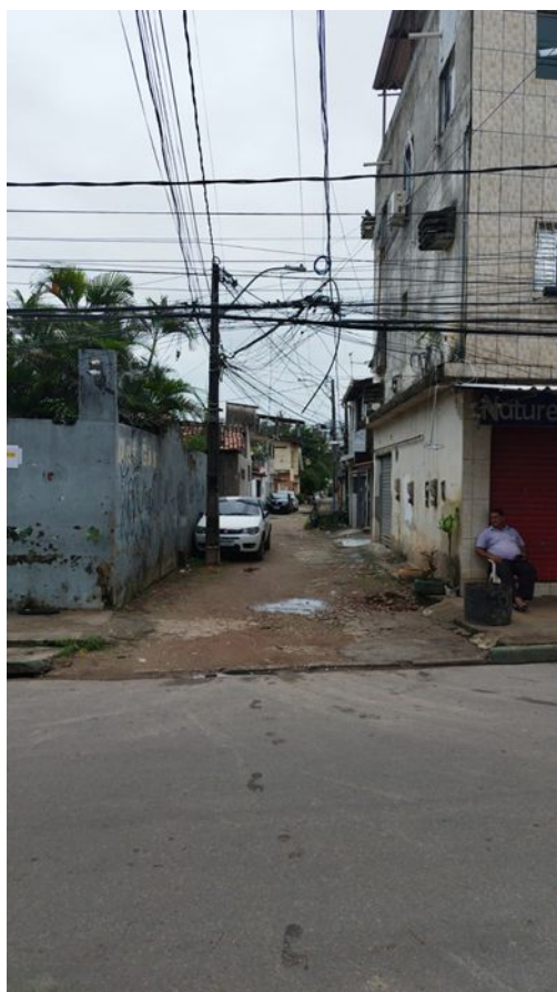
Figura 1 (fim) e Figura 2 (início) – Localização da Rua Bom Jesus da Lapa, Bairro Torre, Recife-PE.