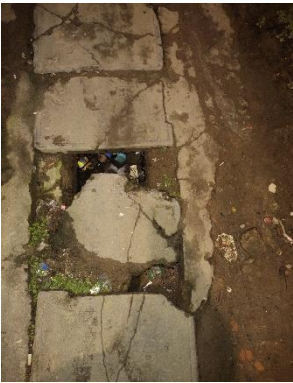
Foto Avenida Barão de Bonito, nº 34, próximo ao armazém São Luiz, Várzea, Recife.