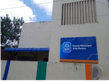
Foto Escola Municipal Alda Romeu, R. Córrego do Deodato, 356 - Água Fria, Recife.