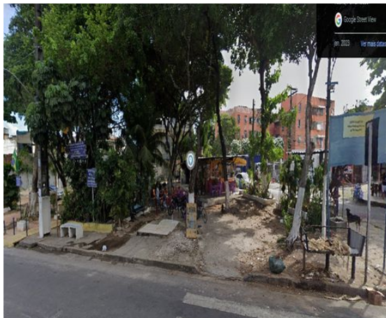
Figura 1: Localização da Praça, que atualmente está em requalificação, na Avenida Tapajós e Rua Ernesto Nazaré, bairro de Areias, Recife-PE.