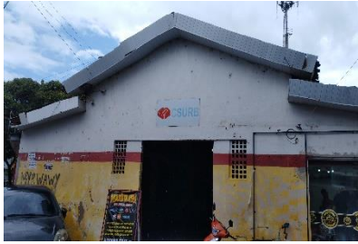
Foto Mercado Público do Pina, Praça Abelardo Baltar - Pina, Recife.