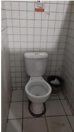
Foto Mercado Público do Cordeiro, Av. Gen. San Martin, S/n - Cordeiro, Recife.