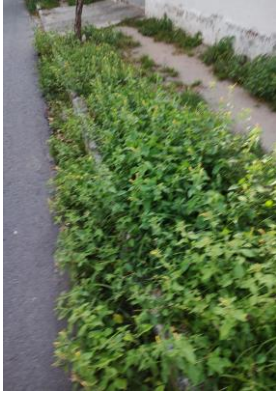
Foto Rua da Coragem, Encruzilhada, Recife