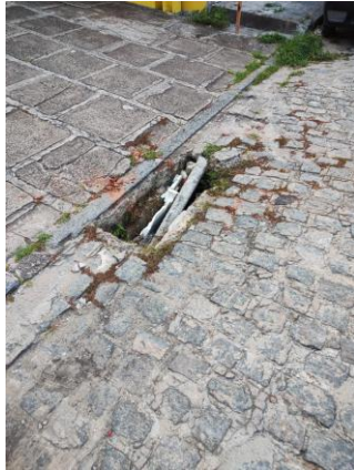
Foto Rua Compositor Antônio Maria, em frente ao número 50, Santo Amaro, Recife.