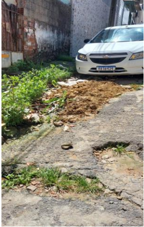
Foto Rua Aurilândia, nº 54, Bomba do Hemetério, Recife.