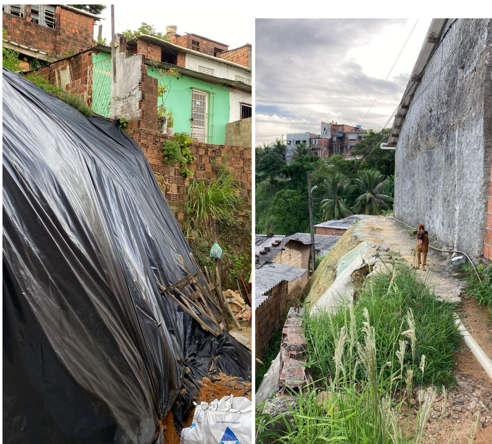
Barreiras na 1ª Travessa Av. Santa Fé, UR-2.