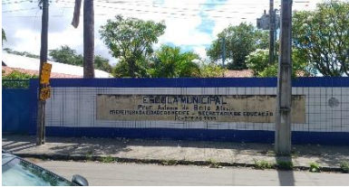
Foto Escola Municipal Professor Antônio De Brito Alves, Rua Ernesto Cavalcanti, 41 - Mustardinha, Recife.