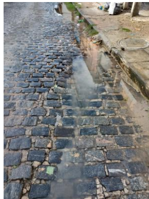
Foto Rua General Carlos Lira, Afogados, Recife.