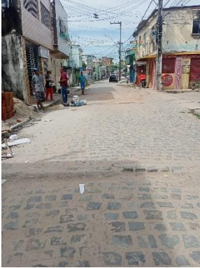
Foto Rua Eurico Vitrúvio, Pina, Recife.