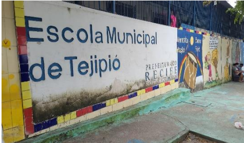
Foto Escola Municipal De Tejipio, R. Tutóia, 165 - Tejipio, Recife.