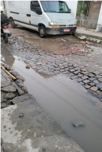
Foto Rua Santo Cristo, Afogados, Recife.