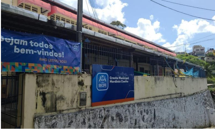
Foto Creche Municipal Mardônio Coelho , R. Sen. Milton de Campos, nº 7 - Vasco da Gama, Recife.