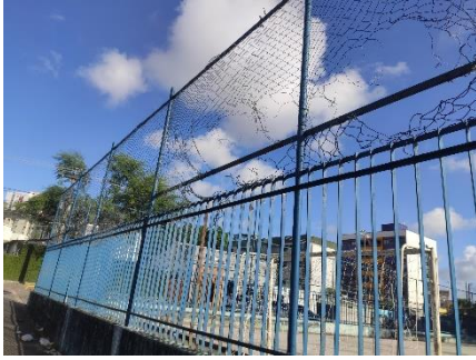
Foto Praça Professor Barreto Campello, Torre, Recife.