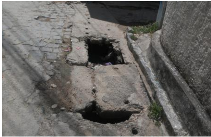
Foto Rua Horizontina, Mangueira, Recife.