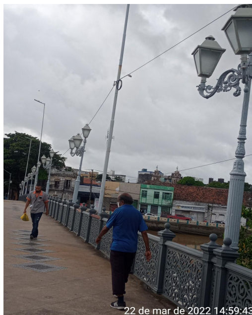
imagem 02: Foto de vistoria em 22 de março de 2022

Além disso, realizamos vistoria que e percebemos, consoante imagens a seguir anexas, a ausência de uma luminária em cada poste: