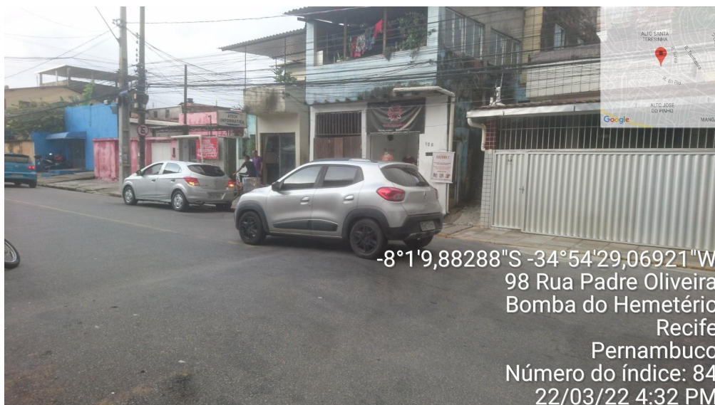
Imagem 01: Foto de Lombada na Rua Padre Oliveira, em frente ao nº 126, no bairro Bomba do Hemetério, foto em 22/03/2022.

seu objetivo, pois os veículos continuam trafegando em alta velocidade pela não visualização antecipada das lombadas e quebra-molas.