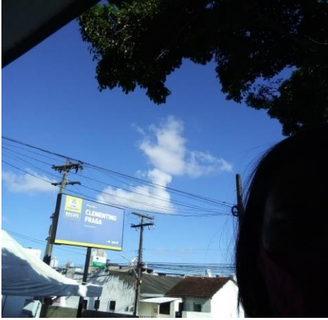
Foto Policlínica Clementino Fraga, Rua. Japarutuba, 260 - Vasco da Gama, Recife.