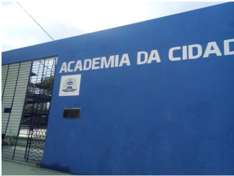
Foto Academia Da Cidade - Polo Joana Bezerra, Ilha Joana Bezerra, Recife.