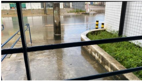
Foto Centro de Saúde Prof. Djair Brindeiro – Comar, R. Cosmorama, 614 - Imbiribeira, Recife.