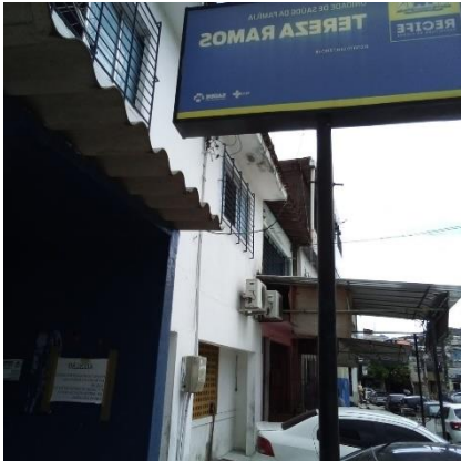
Foto USF TEREZA RAMOS, Rua Alto José Idalino, Brejo da Guabiraba, Recife.