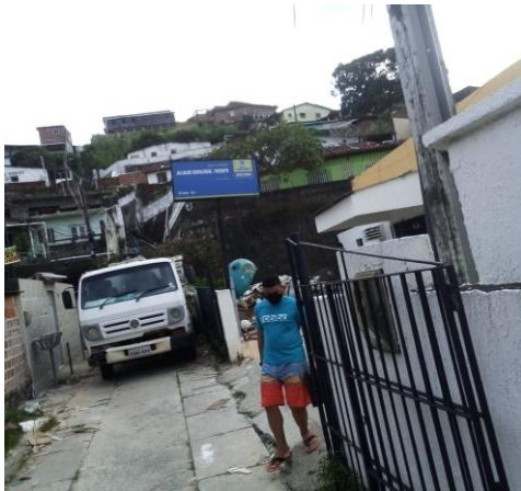
Foto Unidade de Saúde Prof. Bruno Maia, Rua. Alto do Refúgio - Nova Descoberta, Recife.