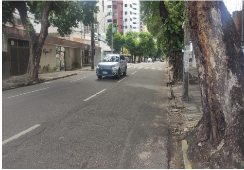
Foto Rua Quarenta e Oito, Espinheiro, Recife.