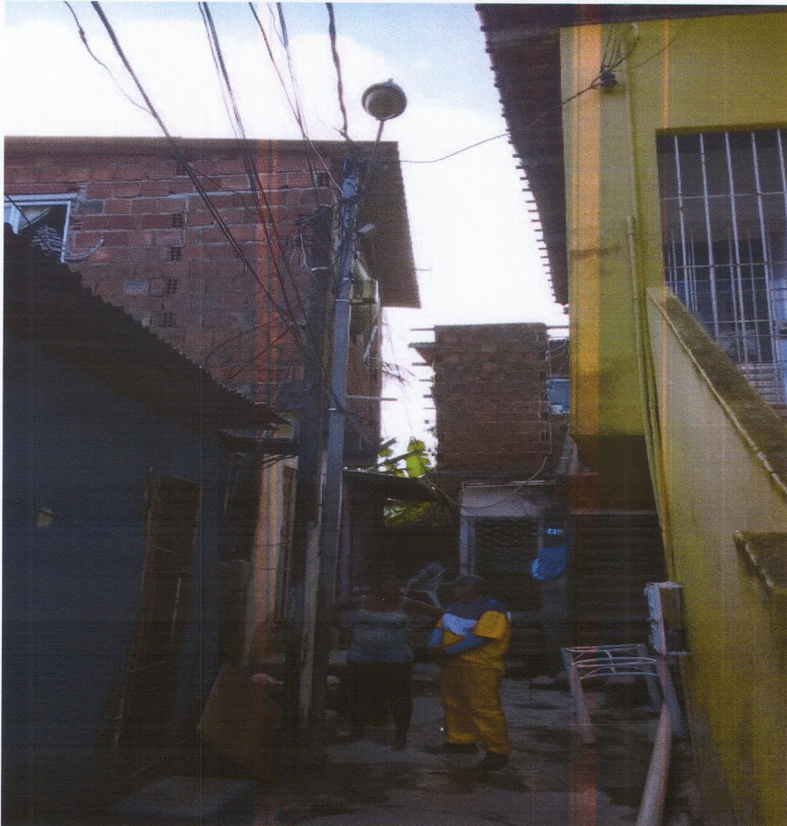
Foto da 1º Travessa da Rua dos Prazeres