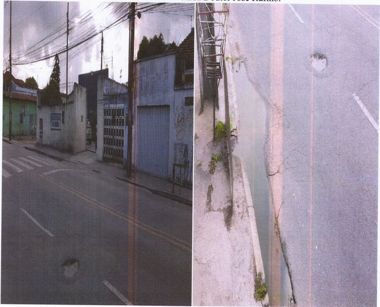
FOTOS 1 e 2 da Avenida Doutor José Rufino.