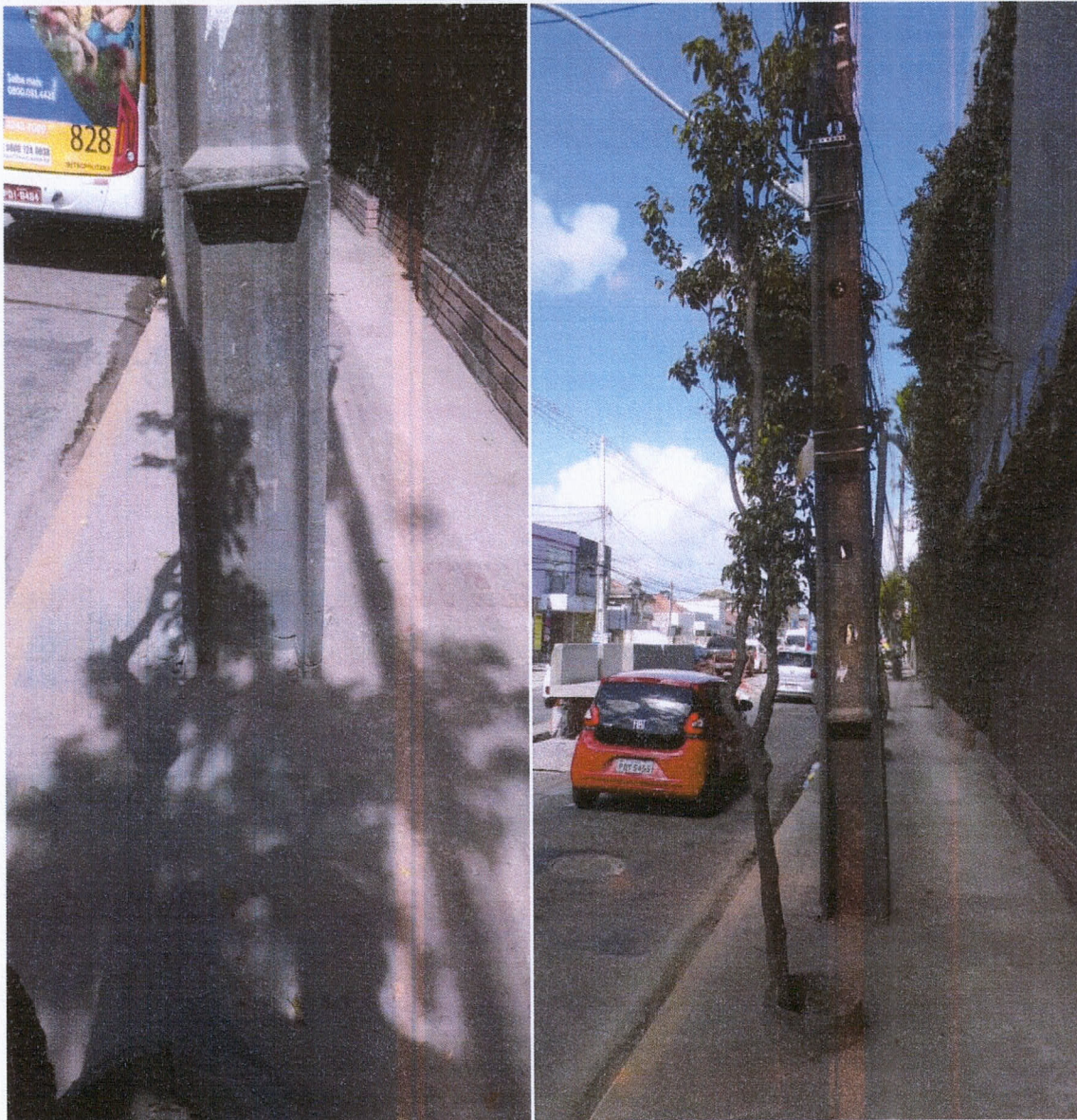
Fotos 1 e 2 da Avenida Doutor José Rufino