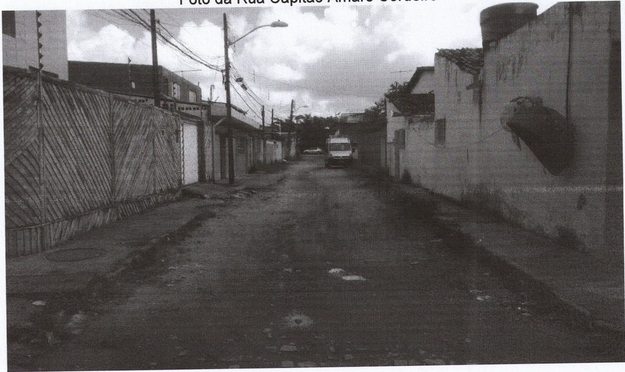
Foto da Rua Capitão Amaro Cordeiro