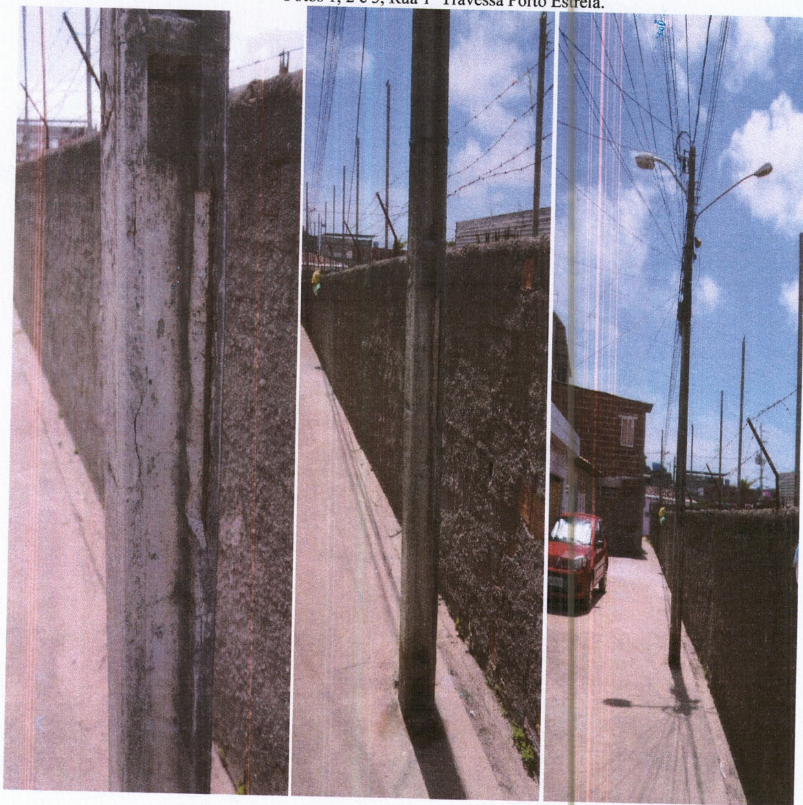
Fotos 1, 2 e 3, Rua 1º Travessa Porto Estrela.