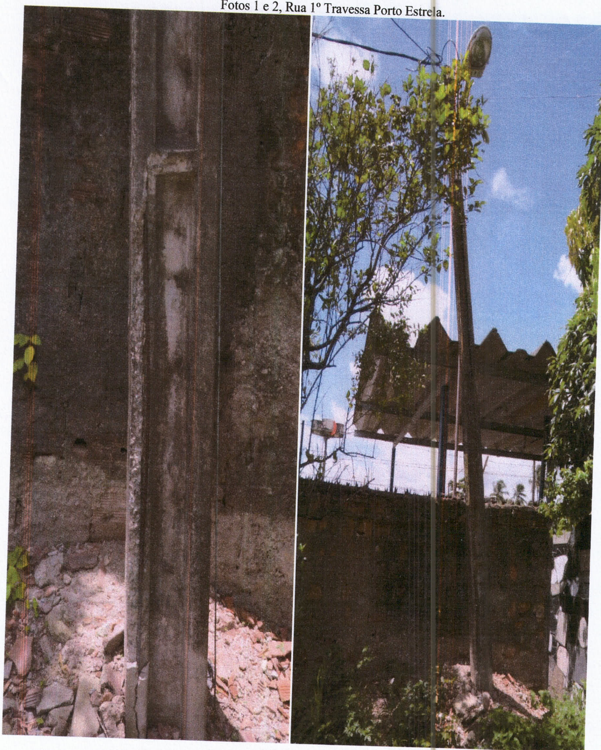
Fotos 1 e 2, Rua 1º Travessa Porto Estrela.