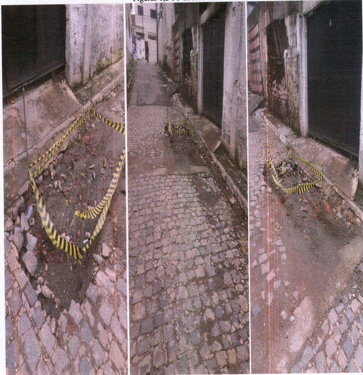
Figuras 1,2 e 3 da Rua Santa Maria.