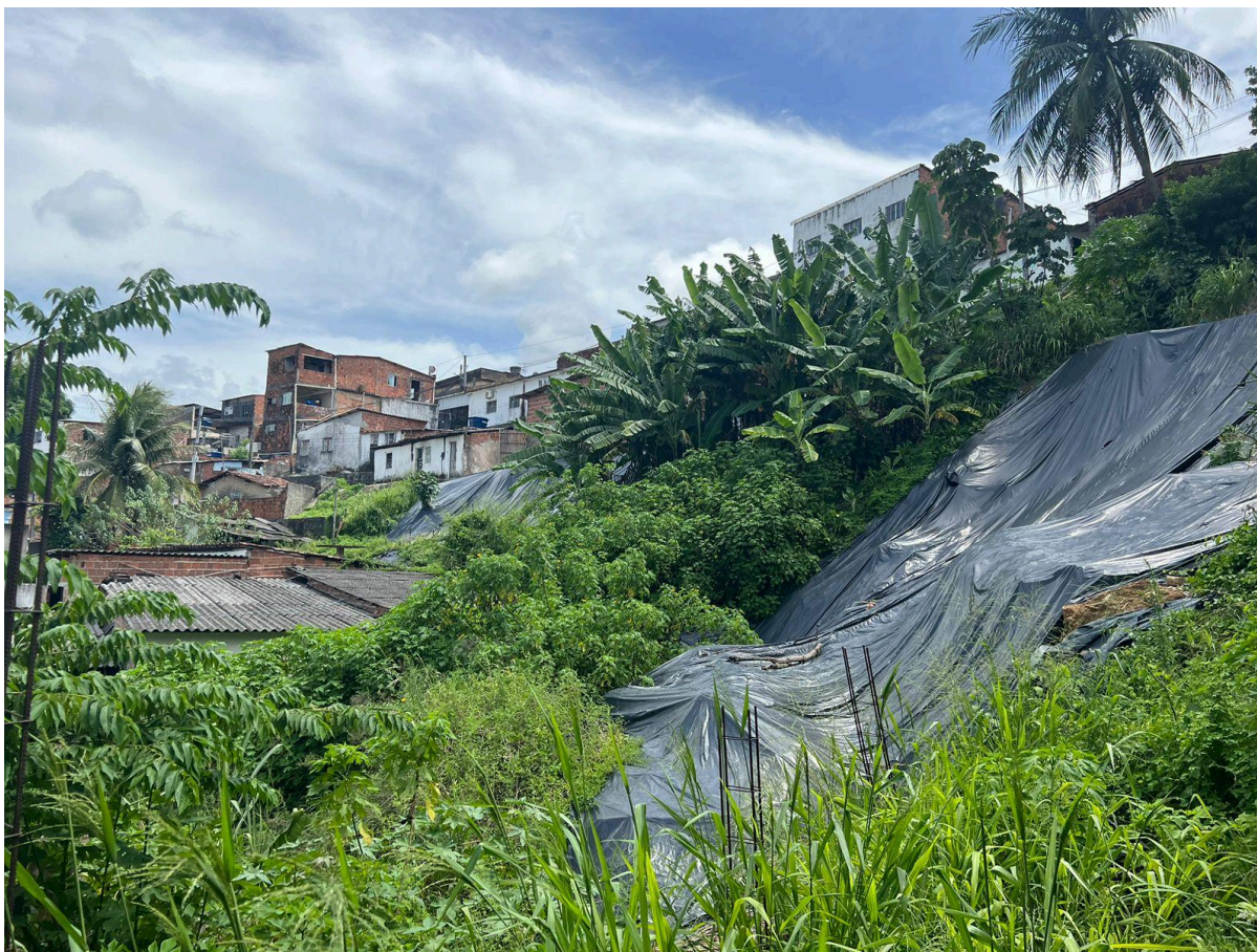
Imagem 01- Barreira localizada na Rua Gonçalves Crespo, UR-1, nº 52, Recife - PE, 51280-370.