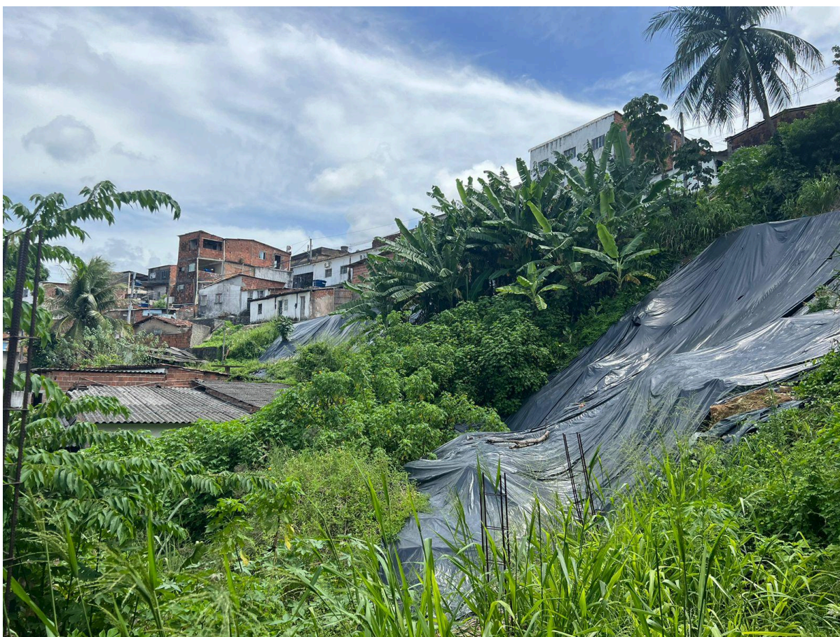
Imagem 01- Barreira localizada na Rua Gonçalves Crespo, UR-1, nº 52, Recife - PE, 51280-370.