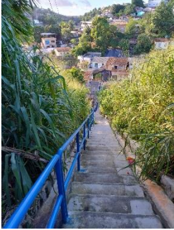
Foto Rua Araguaiana, n 126 - Vasco da Gama, Recife.