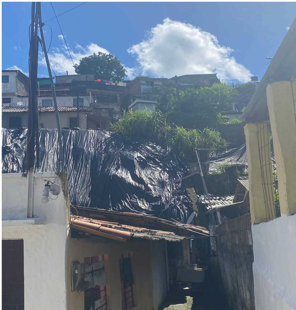
Barreira situada à Rua Vasco da Gama, 1970 - Vasco da Gama, Recife - PE, 52190-135