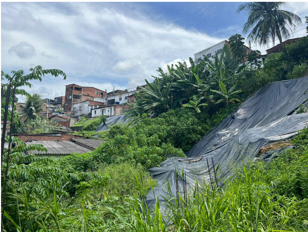
Imagem 01- Barreira localizada na Rua Gonçalves Crespo, UR-1, nº 52, Recife - PE, 51280-370.