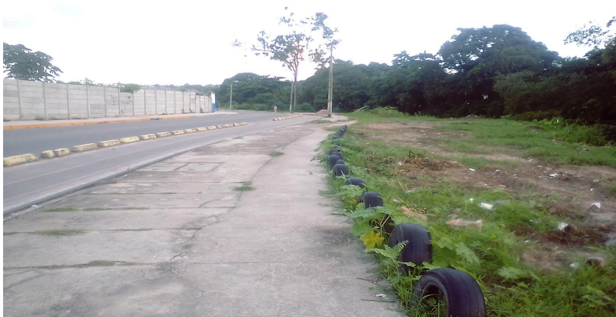
Imagem 1 - Margens do Rio Beberibe, à Rua Compositor Vinícius de Moraes, no bairro de Dois Unidos.