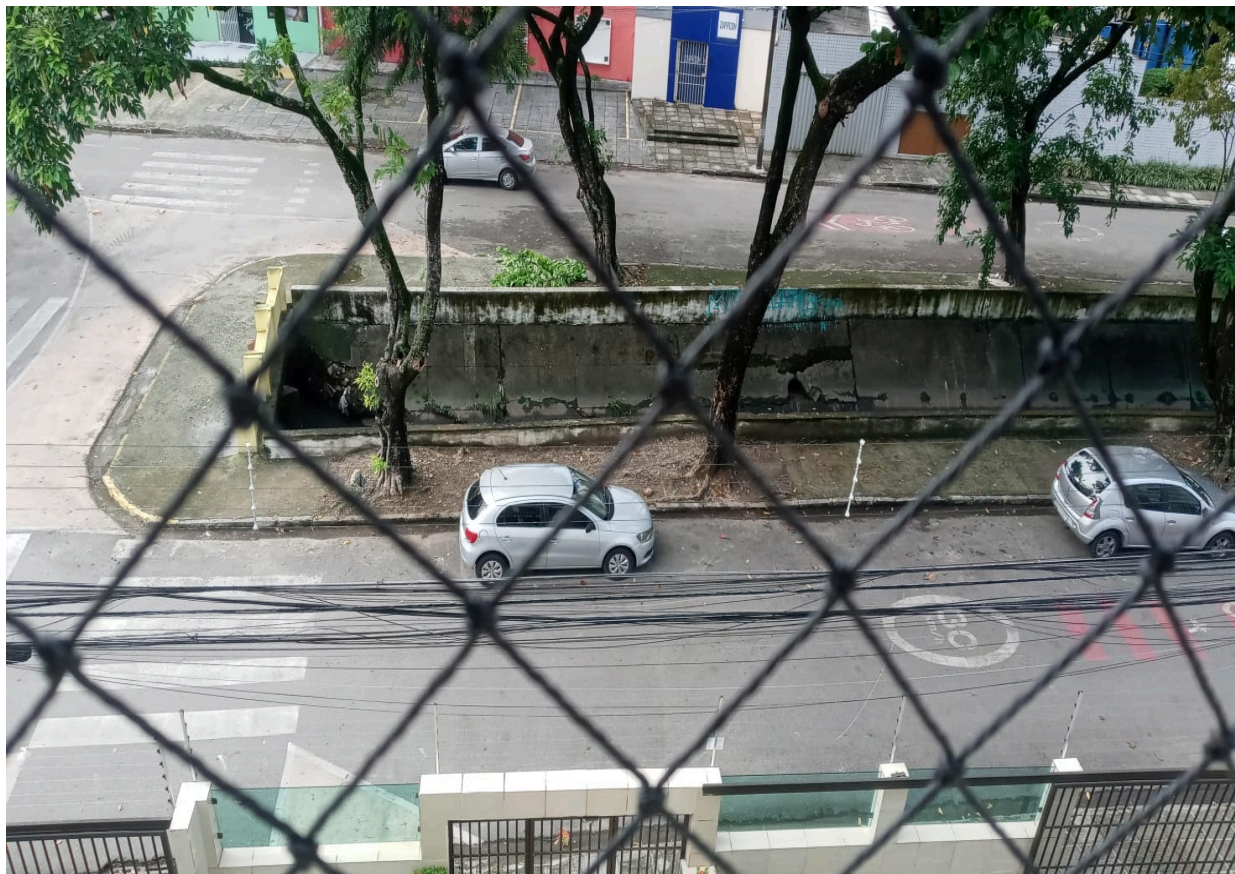
Imagem - calçada inacabada situada à Rua Ricardo Salazar, próximo ao nº 287, Madalena, Recife - PE, 54720-210.